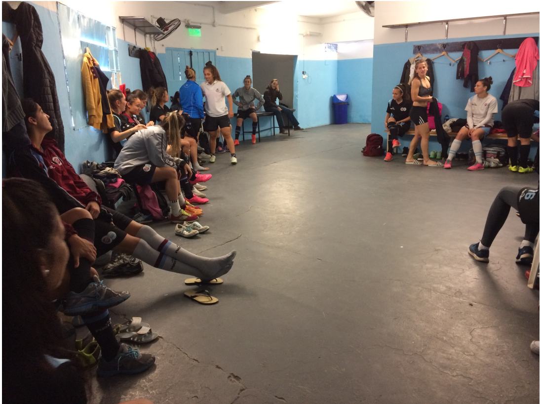
El vestuario local en Villa Lynch. Las jugadoras se preparan para entrenar.