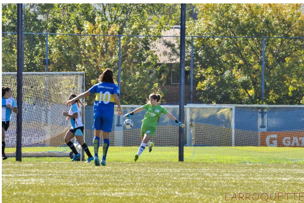
Sacando de volea contra Boca Juniors.