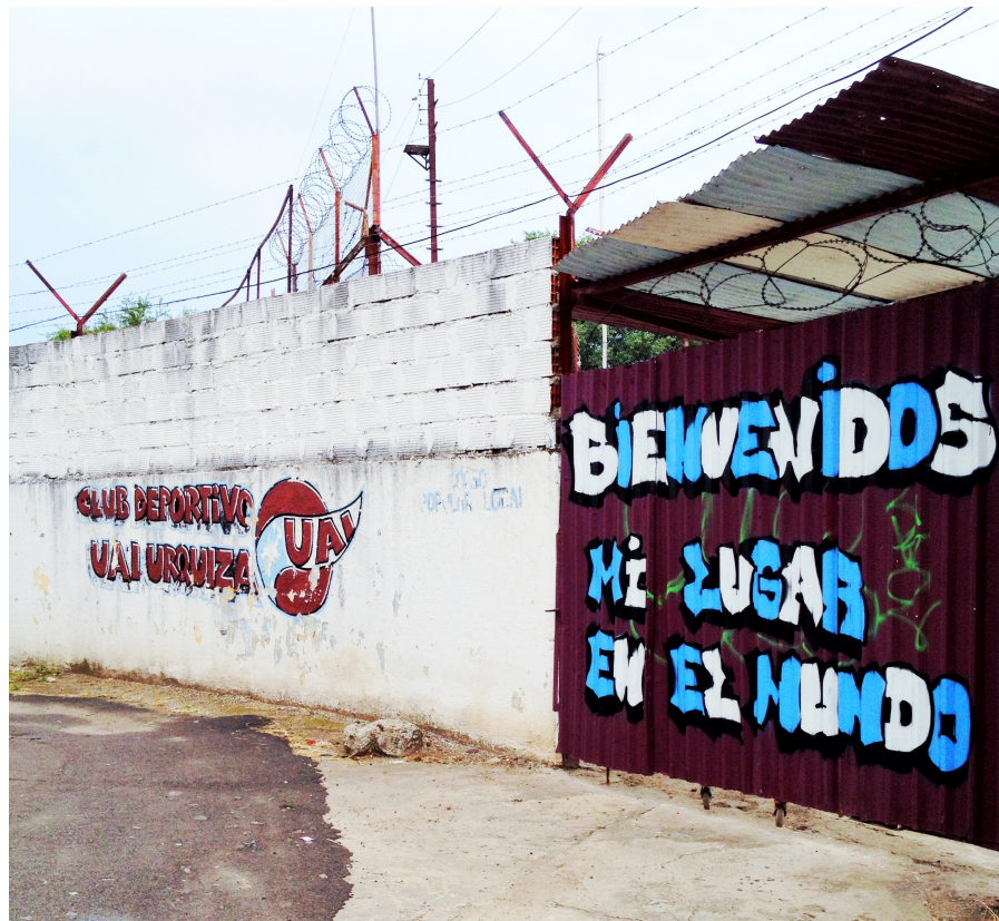
Las paredes que rodean el Monumental de Villa Lynch