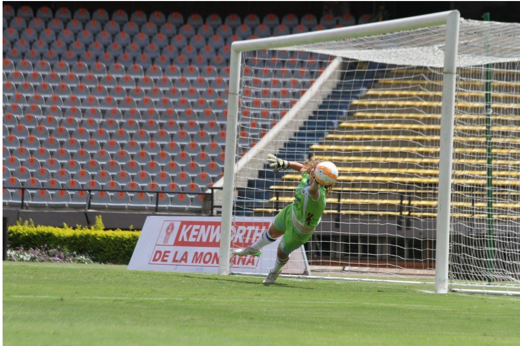
El último penal contra San José de Brasil en el partido de tercer puesto en la Libertadores 2015.