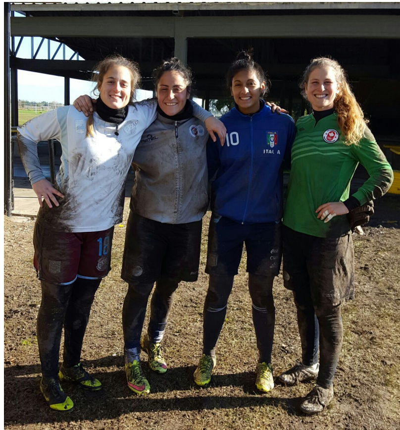
Las arqueras luego de entrenar en Rancho Taxco. (Yo soy la que tiene el buzo verde)