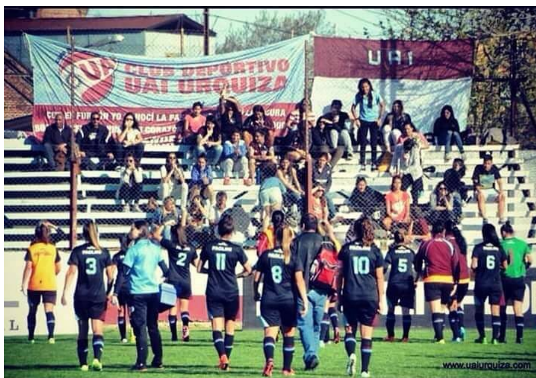
Partido de local en Villa Lynch con vista a la tribuna. www.uaiurquiza.com