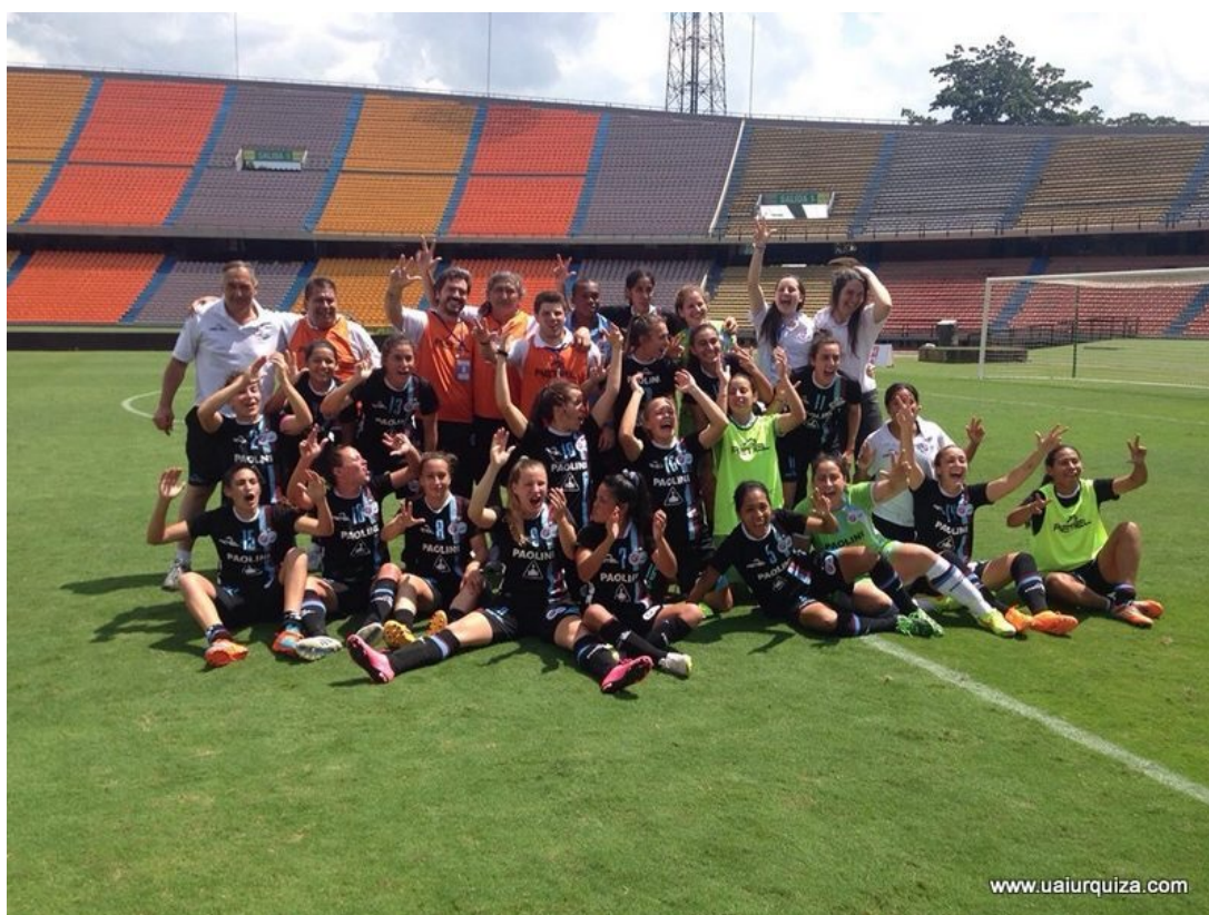
Festejando el tercer puesto en la Copa Libertadores Femenina 2015 en Medellín, Colombia. www.uaiurquiza.com