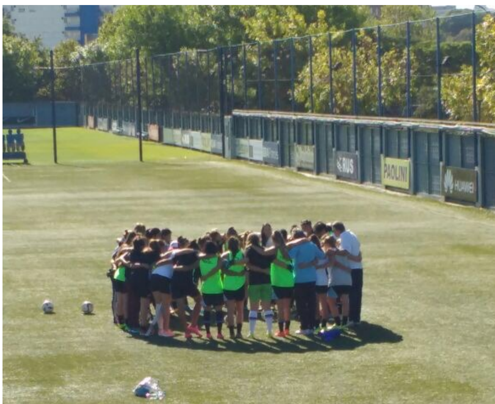
Reunión motivadora previa a un partido con Boca Juniors de visitante en Casa Amarilla.