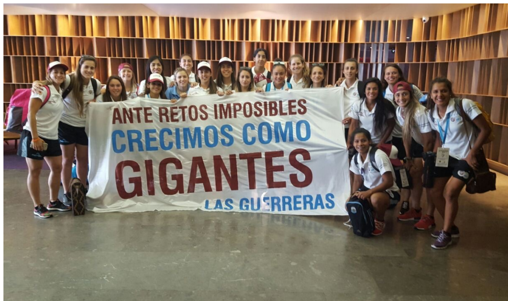
Antes de salir para la cancha en la Copa Libertadores 2016 en Montevideo, Uruguay. www.uaiurquiza.com