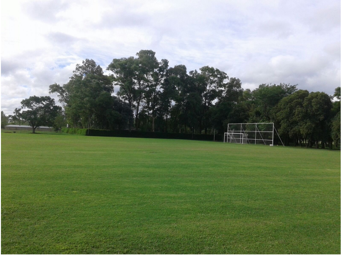
Una cancha de entrenamiento de la primera masculina y femenina en Rancho Taxco.