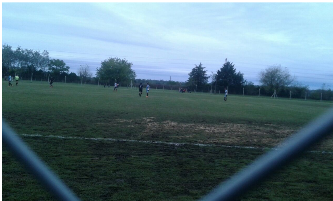
Partido oficial de local en Rancho Taxco.