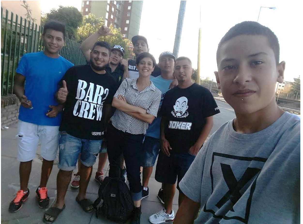
Con Clika Madero y MDR Records crew en Villa Madero.