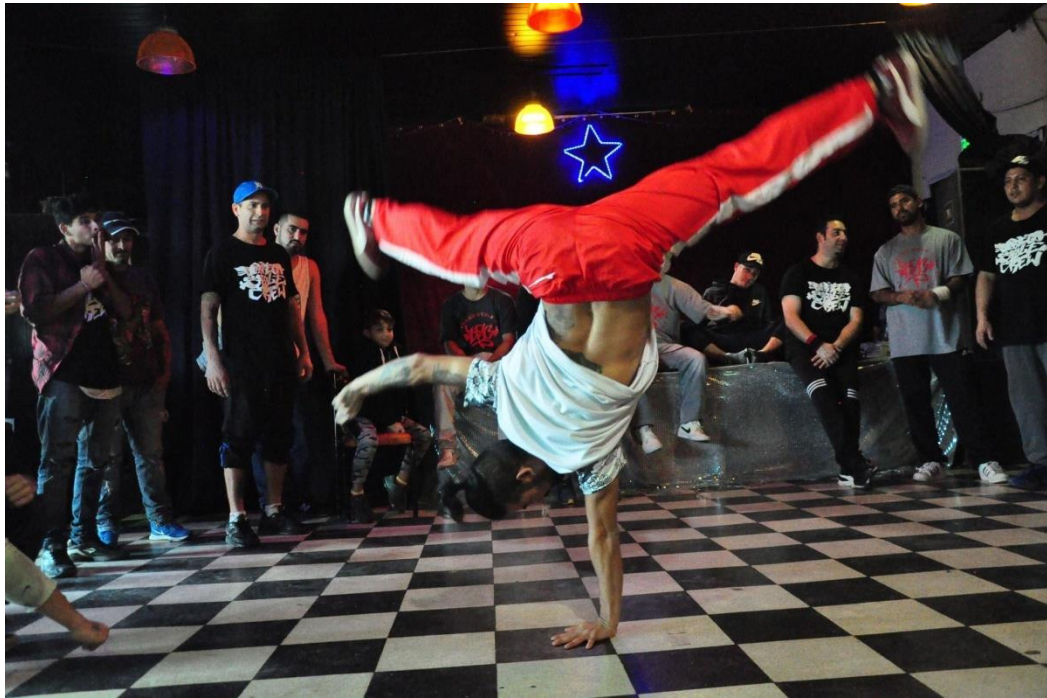
Competencia de break dance en un evento de rap en Isidro Casanova.

vida similares. Se conjetura que el valor que tiene la sociabilidad en estas escenas influye en que los actores de este estudio no reciben ninguna remuneración económica al cantar en estos espacios, ni tampoco al organizarlos. De cierta manera, refleja uno de los aspectos que caracterizan a los actores, en que no viven económicamente del rap, pero sí de otra manera: como una actividad a la que dedican tiempo, energía y con la construyen sus formas de llevar sus vidas.