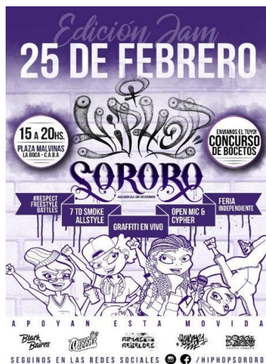
Flyer del evento “Hip hop sororo” 52 .