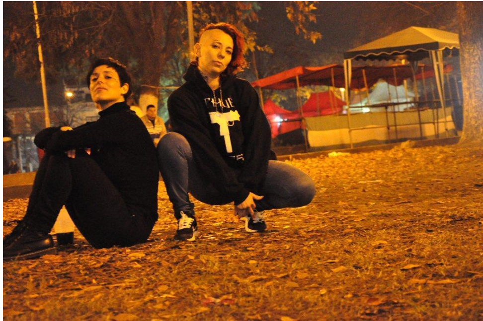
Free Soul y yo en el evento de Cypher Luro .

especie de magnetismo en gran medida por la activación y oferta de escenas que se realizan allí, y se volvió referencia para mi trabajo.