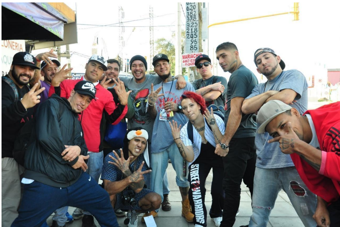
Raperos, b-boys y acompañantes posan simulando el código postal de González Catán.