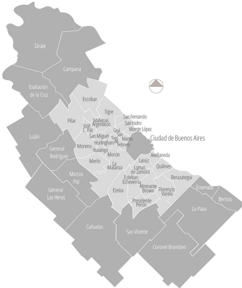
Mapa 2 del AMBA

Observatorio metropolitano-Consejo profesional de arquitectura y urbanismo (2020). Mapa de la Región Metropolitana de Buenos Aires. [Figura] Recuperado de: http://www.observatorioamba.org/planes-y-proyectos/rmba#descripcion 16 de enero de 2019.