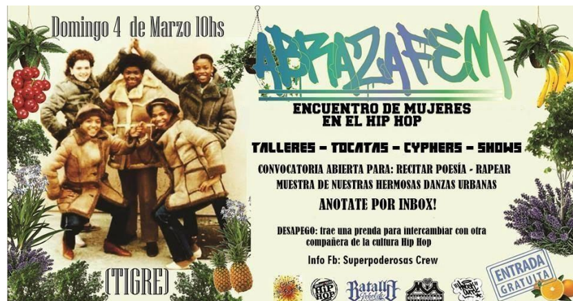
Flyer del encuentro “Abrazafem” 55 .