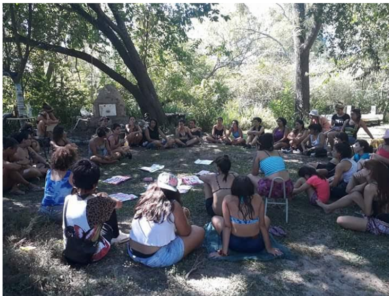
Encuentro “Abrazafem”.

En la primera actividad nos presentamos diciendo la localidad de la que veníamos y las motivaciones que nos hicieron asistir al encuentro. Las respuestas coincidían con el propósito de “conocer quiénes somos las que estamos en la movida”, “encontrarnos”. Abrazafem había tenido el poder para reunir a varias mujeres de disímiles lugares del AMBA y de otras regiones del país: de lejos, de cerca, nos encontrábamos ahí. Entre las actividades participamos en un taller de rap, uno de break, y otro sobre el aborto legal, seguro, gratuito y autónomo dirigido por una colectiva feminista. Entre las actividades del programa, tuvimos varios espacios para conversar, conocernos y convivir. Varias raperas y b-girls compartían entre ellas sus consejos para mejorar ciertos pasos, así como técnicas para cantar enfrente del escenario y perderle miedo al público. En el tramo final de la jornada, las participantes subieron al escenario. En orden de la lista que ellas habían conformado, empezaron a rapear y a cantar. Dado que se podía también compartir algún poema o reflexión, me sentí interpelada por la ocasión a vencer el sentimiento de timidez para sacar la voz y pasar al frente para leer un escrito hecho por mujeres de mi país.