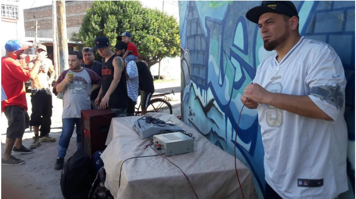
Onestho prepara los controles en el evento “Oeste Under”.

Esta experiencia permite colocar la noción que empleamos para conocer la relación que los jóvenes establecen con el espacio urbano y cómo desde la práctica construyen territorios. Nos muestra que el rap es una práctica espacializada, que se produce en relación con el espacio. Ello quiere decir que ni la práctica ni el espacio están “dados”, sino que se producen mutuamente: en el caso del evento “Oeste Under”, a través del uso y apropiación que hicieron de la calle con las rondas de free , la instalación de parlantes, distintos equipos de sonido y la misma música que hizo el evento posible. La calle entendida como espacio físico y simbólico es clave para comprender la práctica, ya que se trata de una categoría central con la que los jóvenes caracterizan al rap y a sí mismos como practicantes. Allí se gestan los modos en que experimentan su condición como jóvenes raperos, y constituye un lugar fundamental para su socialidad: es donde se encuentran, ríen, charlan de día o de noche, comparten cerveza, comparten “faso”, cantan rap, se avientan un freestyle (Raposo, 2015: 5). La calle es el escenario inminente donde ocurre la “ranchada”, las maneras en que los jóvenes comparten el “estar juntos”; es ahí donde emana el rap, su potencia y capacidad de multiplicación (Mora, 2018:8). Así