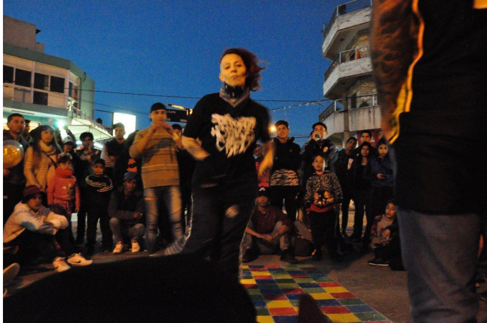
Free Soul a punto de disputar en la “competencia” de break en Cypher Luro.

experiencias espaciales 25 . Los parques, las plazas, a pesar de no ser puntos de referencia para el rap, también fungen como espacios donde organizan y participan en competencias y presentaciones en vivo.