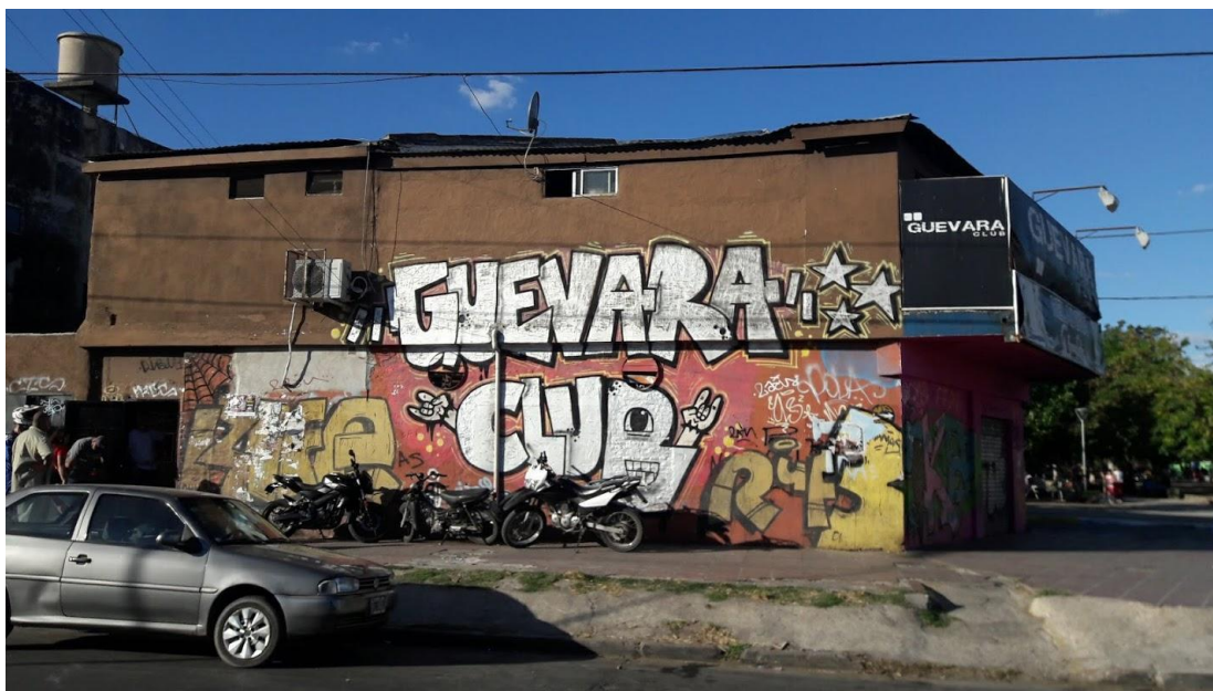
Guevara Club, Laferrere.