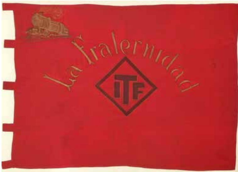
Figura 6. Bandera del Sindicato La Fraternidad.

Como bien resume Hobart Spalding en La clase trabajadora argentina , a partir de 1853, mientras la Argentina se consolidaba política y geográficamente, al tiempo que se sumaba progresivamente al sistema económico mundial, se produjo un precipitado crecimiento de la clase trabajadora del país, favorecido por el arribo programado de miles de inmigrantes europeos, fenómeno impulsado intencionalmente por la elite gobernante que regía el destino económico de Argentina. Llegados desde el Viejo Continente, estos trabajadores, además del conocimiento de su oficio, traían consigo las primeras ideas sociales y la experiencia obrera de hacer huelgas en defensa de sus derechos, el modo de organizarse y agruparse en pos de sus intereses como clase trabajadora. Más adelante, entre los años 1887 y 1890, período signado por una inflación descontrolada y una consecuente precarización de la vida, particularmente en el ámbito de Buenos Aires, diversos gremios obreros reunieron a sus trabajadores en asociaciones y sindicatos. 10 Entre ellos, desde su fundación en junio de 1887, La Fraternidad, sociedad que agremiaba a los maquinistas y foguistas de locomotoras, tuvo un verdadero carácter sindicalista. 11 Prontamente,