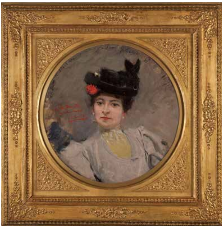
Figura 3. Retrato de la Sra. Darclée , óleo sobre pergamino de Joaquín Sorolla y Bastida.

Aprovechamos la existencia de un aro externo, también de madera, que secundaba y complementaba por fuera al bastidor fragmentado. Clavado a este último con tachuelas, conservándose indemne, ayudó a mantener cierta estabilidad estructural y dimensional de gran parte de la obra durante el tratamiento.