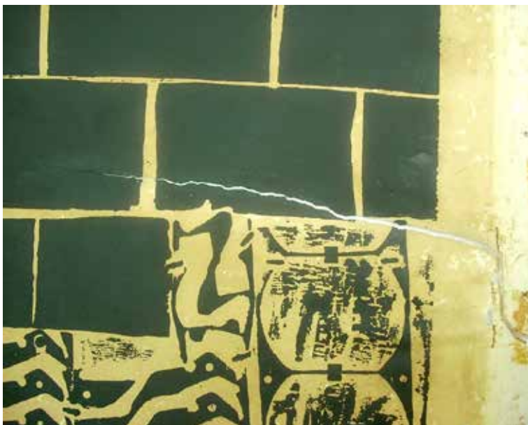
Figura 2. Detalle de la rotura del papel.

bordes manchaban el soporte de papel y apenas lo sujetaban al terciado de madera. Con todo, optamos por el tratamiento conjunto que incluía el acondicionamiento de la obra y el del soporte accesorio original, de madera, que habíamos decidido conservar, ya que se constituía como parte integrante de la obra.