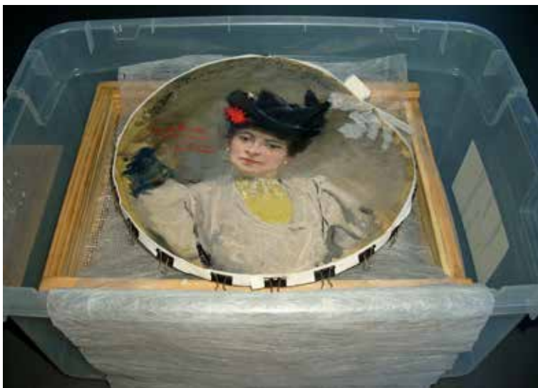
Figura 4. La obra en cámara de humectación.

de humedad podía aumentar la transparencia y el color del pergamino y, a la vez, generar desprendimientos de la capa pictórica y alterar su aspecto.