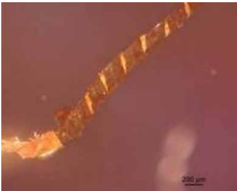
Figura 7. Imagen de una muestra de hilo metálico visto con luz polarizada (100x).

Con respecto a los antecedentes inherentes a la conservación de la bandera, integrantes de “La Fraternidad” refirieron que durante décadas la enseña sindical había sido guardada en una pequeña caja de madera, plegada y arrugada.