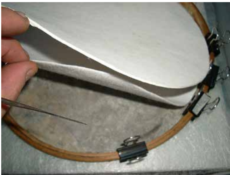
Figura 5. Humectación controlada con Gore-tex® (detalle).

Por último, el tercer caso es acerca de un objeto textil, que llegó al Centro Tarea en el año 2014 para su estudio, puesta en valor y guarda. Se trataba de una bandera, insignia patrimonial del sindicato del personal ferroviario de maquinistas “La Fraternidad” que fue probablemente confeccionada hacia 1906 (figura 6). Le dedicaremos un sucinto comentario desde el punto de vista histórico para contextualizar el objeto y comprender posteriormente la conducta conservativa.