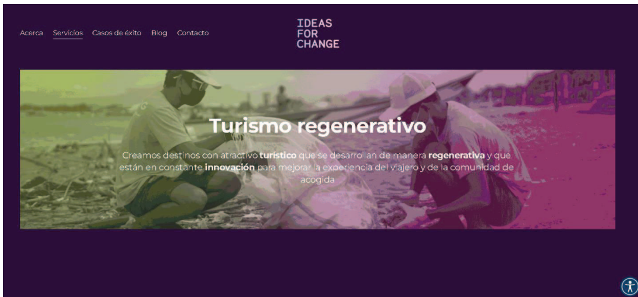
Fig. 2 Ideas For Change