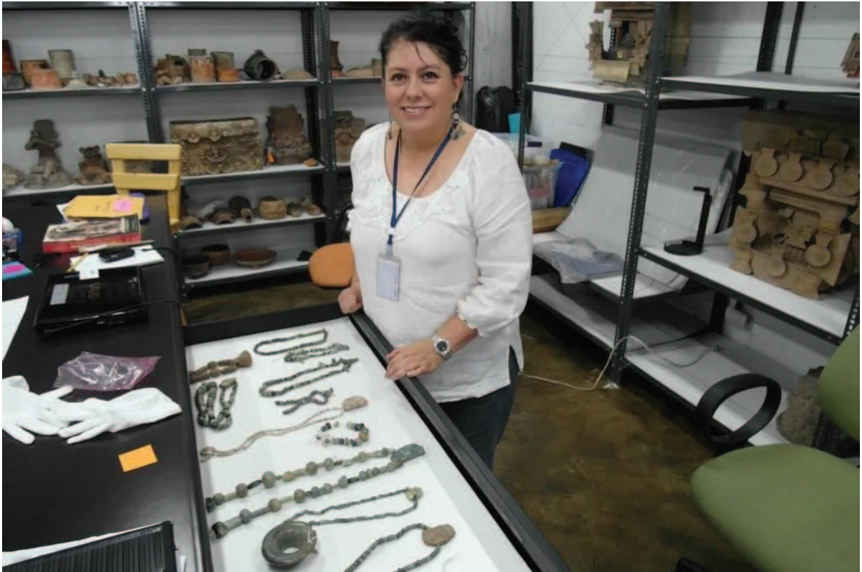
Fig. 3 Ruta Maya