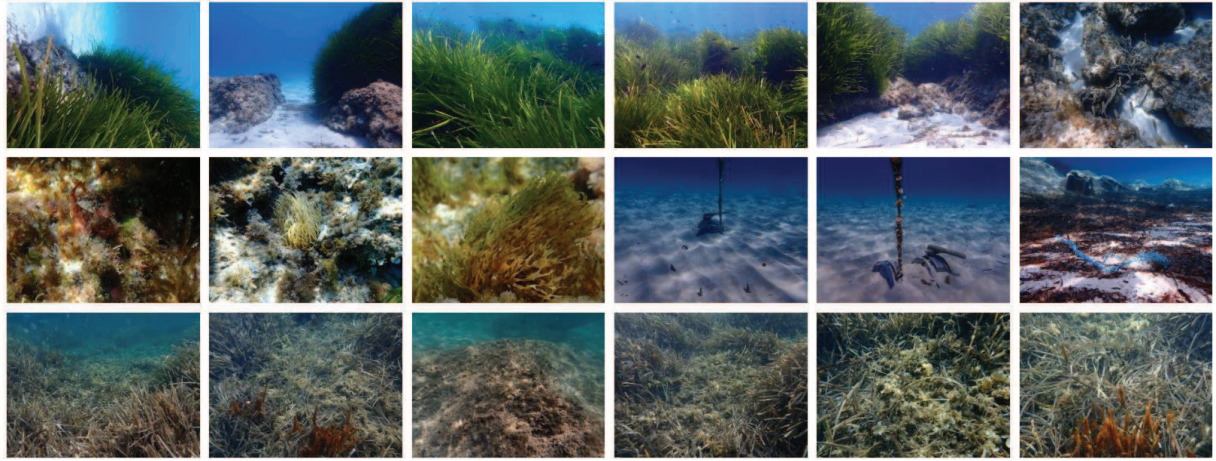
Fig. 1 Ibiza sostenible.