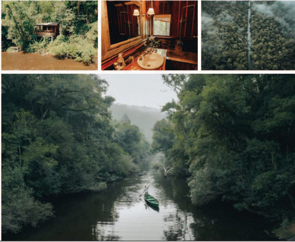
Fig. 5 Reserva de Margay (El Soberbio)