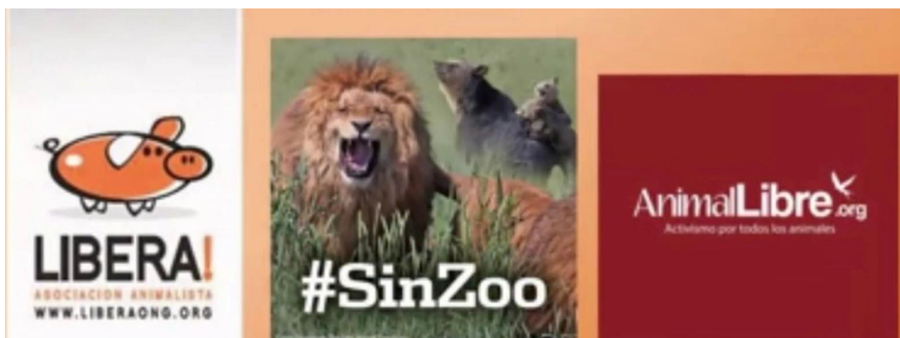
Foto 6. Logos de las agrupaciones animalistas en Argentina.

En la foto 6 pueden observarse tres imágenes que identifican a las tres agrupaciones que conforman el Movimiento Animalista.