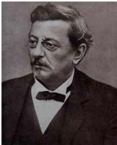
El primer director del Jardín Zoológico el Dr. Eduardo Ladislao Holmberg, aquí retratado en 1915.

El emplazamiento que tendría sería el definitivo y el que conocemos esto es: el predio existente entre las avenidas del Libertador, Las Heras, Sarmiento y la calle República de la India. El 20 de setiembre de ese mismo año se nombra Director del Jardín Zoológico por crearse, al Dr. Eduardo Ladislao Holmberg. (Esparrach 2022, 29)