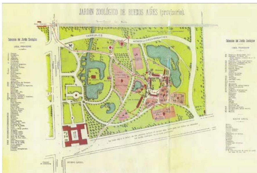
Plano del primer Zoológico de Buenos Aires y referencias a su finalización.