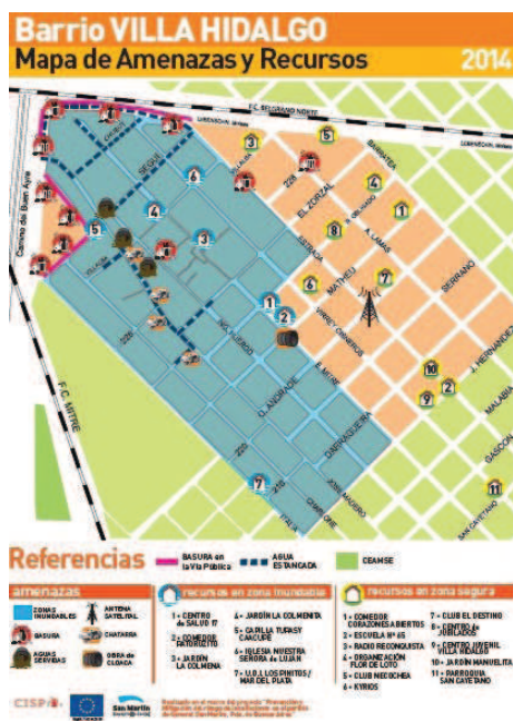
Mapa 2. Villa Hidalgo.