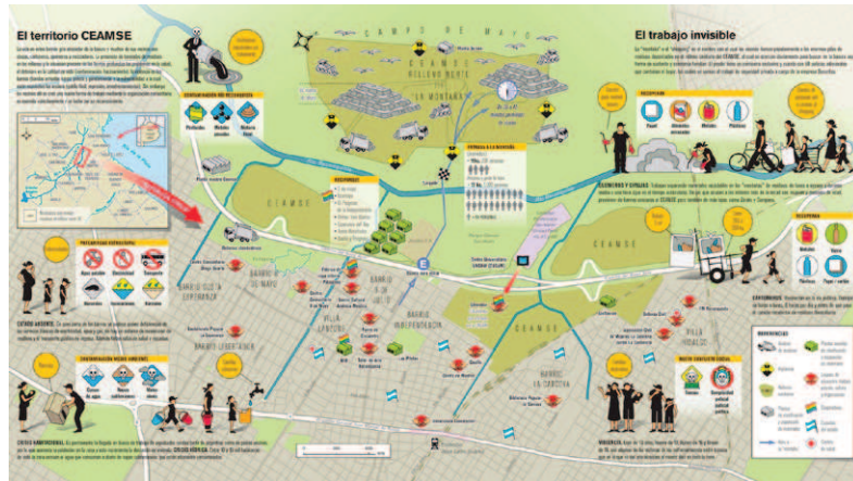
Mapa 1. Área Reconquista e impacto de la economía de la basura.