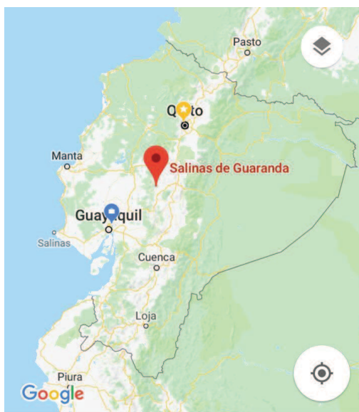
Figura 1. Localización de Salinas dentro de Ecuador.

Dentro del sitio web del Gobierno Autónomo Descentralizado Parroquial Rural de Salinas, se menciona que la población total registrada en la parroquia durante el censo realizado en el 2010 fue de 5.821 habitantes. Al ser una parroquia rural, las principales entidades de gobierno seccional con injerencia en la localidad son Gobierno Provincial de Bolívar, Gobierno Autónomo Descentralizado Municipal de Guaranda y Gobierno Autónomo Descentralizado Parroquial Rural de Salinas; todos con autoridades elegidas democráticamente.